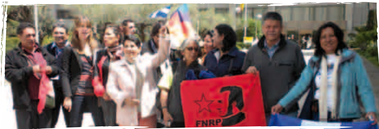
Deputadas e representantes de organizacións sociais centroamericanas diante do ministerio de Comercio, lugar onde se asinou o ADA UE-CA.

6 Pérez Rocha, M., Hernández González, G., Orozco, J. (2006) "Hacia un Acuerdo de Asociación entre Centroamérica y la Unión Europea. ¿Un Instrumento para el desarrollo y los derechos humanos o un CAFTA II?. Presentación de preocupación e propostas no contexto do IV Cumio de Xefes de Estado e de Goberno da Unión Europea, América Latina e o Caribe. CIFCA