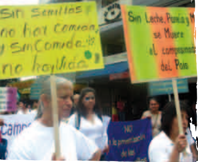
Movilización campesina por la soberanía alimentaria en Colombia. Autor: Penca.