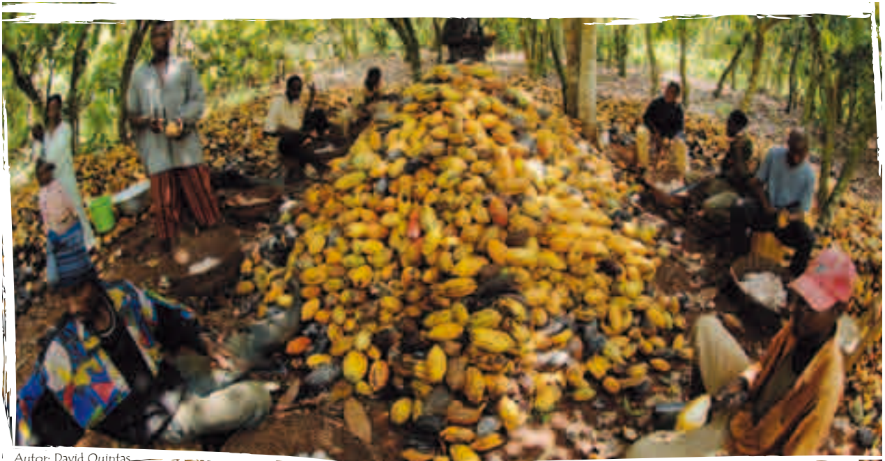
Autor: David Quintas

Redacción: Equipo de la campaña Acuerdos Comerciales de la Federación SETEM