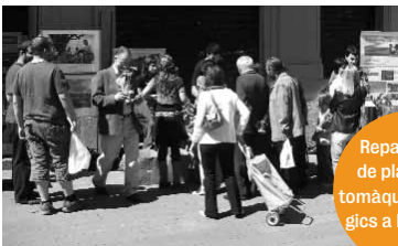
Repartiment de plantes de tomàquets ecològics a Pamplona

www.viacampesina.org www.greenpeace.org/espana /campaigns/transgenicos