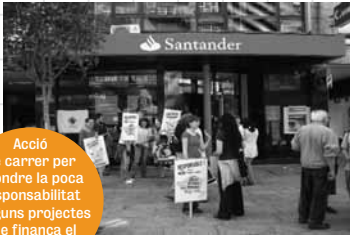
Acció de carrer per difondre la poca responsabilitat d'alguns projectes que finança el Santander