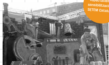
Un dels espectacles de sensibilització de SETEM Catalunya

de la solidaritat i la cooperació. Els objectius del grup són reflexionar al voltant de l'educació i col·laborar amb l'elaboració de materials pedagògics, tal com està succeint amb la guia francobrasileira Comprendre per actuar , dirigida al professorat i a dinamitzadors. Aquesta guia conté una part teòrica i fitxes didàctiques sobre el comerç internacional, el Consum Responsable o el Comerç Just. El grup està actualitzant i adaptant els continguts al context català. Està previst que es presenti la guia al juny de l'any vinent.