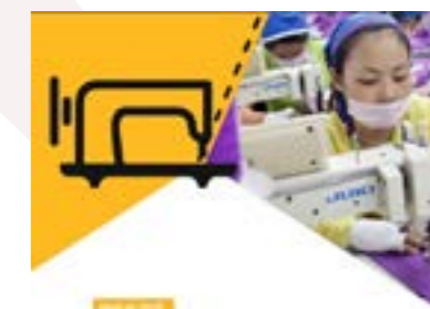
Campaña Ropa Limpia Informe sobre transparencia

La industria textil tiene complejas cadenas de producción y responsabilidad en las que intervienen una gran variedad de actores a todos los niveles. entre los escombros.