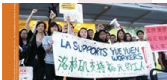
Un camino complicado: La lucha por los derechos laborales

La lucha por los derechos laborales en la industria del calzado en China