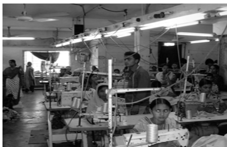
Trabajadores del textil en Bangladesh, proveedores de ropa para Lidl.

Los objetivos de esta Campaña son reivindicar y promover la mejora de la situación laboral de los trabajadores y trabajadoras del sector textil en los países del Sur , a través de la sensibilización, la denuncia y la presión a las grandes multinacionales del sector para que sean transparentes en toda su cadena productiva. Desde 1996, a nivel Estatal, la Campaña Ropa Limpia está coordinada por la Federación SETEM y cuenta con el apoyo de entidades sociales, sindicatos, y asociaciones de consumidores.